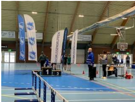
Sør Norsk Mesterskap

I 2024 arrangerte vi: Sør-Norsk mesterskap, Skillingsleker, flere treningsstevner, Kretskarusell, 2 myldrestevner og Nissestevne. Deltakelsen på disse arrangementene har vært god, men målet er at alle klubbene i Agder skal delta på Sør Norsk mesterskap og på Skillingslekene.