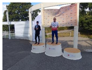
Gull på 200m